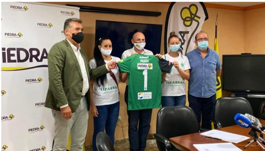
Jugadores, técnicos y representantes de Piedra, en la firma del convenio

El club femenino y la firma de supermercados cordobesa sellan un acuerdo económico publicitario