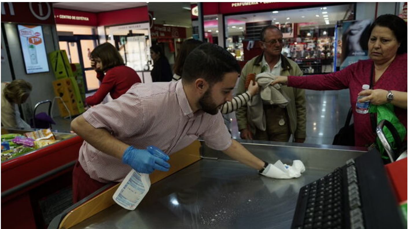
Un trabajador de Deza limpia una caja en el supermercado del Zoco.