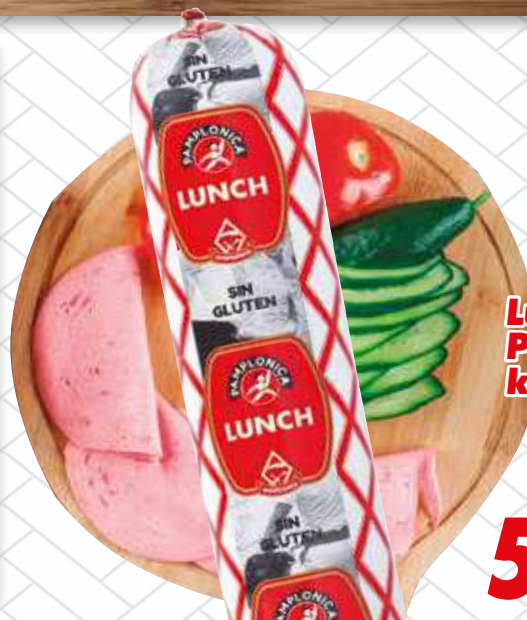
Lunch Pamplonica kilo