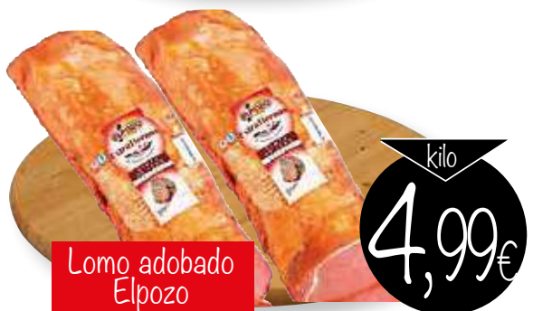
Lomo adobado Elpozo