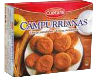
Galleta Campurriana 466 gr. 5,56 €/kilo