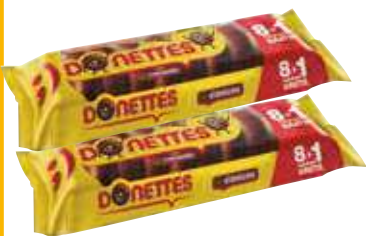
Donettes clásico 8+1 unds. 0,31 €/unidad