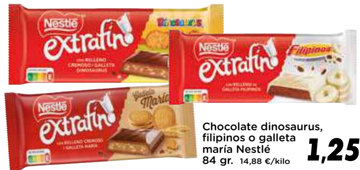
Chocolate dinosauros, filipinos o galleta maría Nestlé 84 gr. 14,88 €/kilo