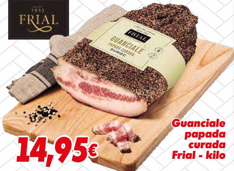
Guanciale papada curada Frial - kilo