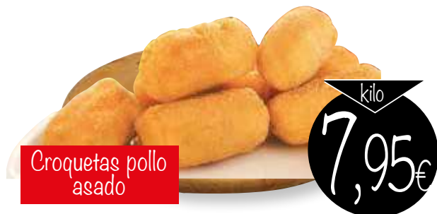
Croquetas pollo asado