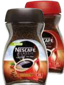
Café natural o descaf. soluble Nescafé 50 gr. 49,80 €/kilo