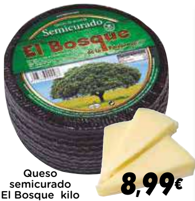
Queso semicurado El Bosque kilo