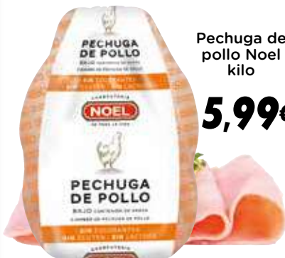
Pechuga de pollo Noel kilo