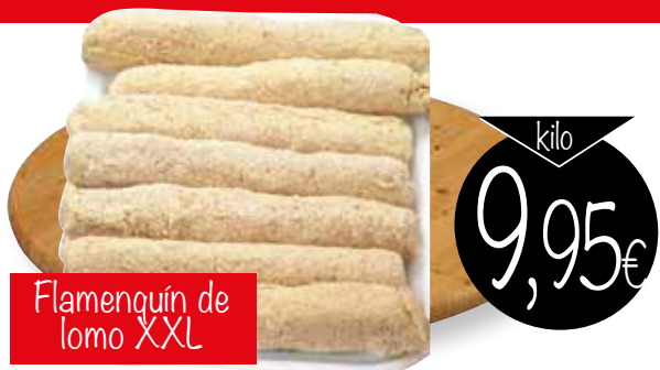
Flamenguín de lomo XXL