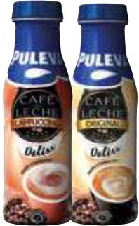
Café con leche o cappuccino Deliss Puleva 220 gr. 5,41 €/litro