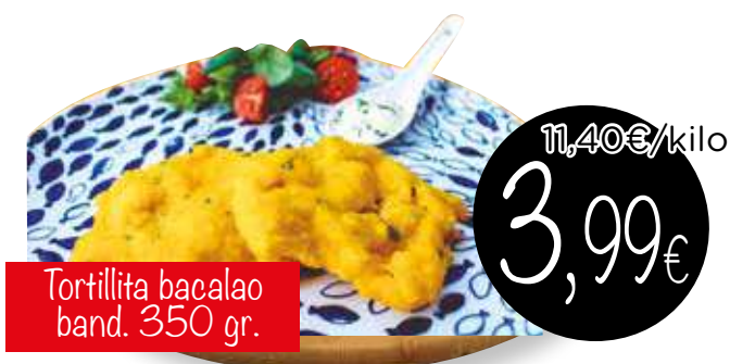
Tortillita bacalao band. 350 gr.