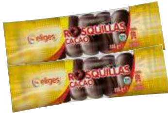
Rosquillas cacao lfa 8 unds. 9,29 €/kilo