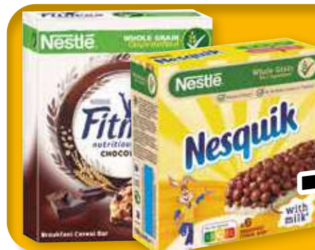
Barritas cereales o Fitness chocolate 6 unds.