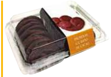
Palmeras chocolate Brezo 300 gr. 9,17 €/kilo