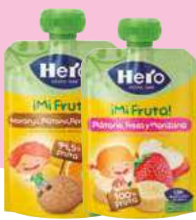
Pouch Nano Hero 100 gr. 9,90 €/kilo