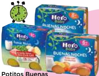
Potitos Buenas Noches gama Hero 2x180 gr. 7,84 €/kilo