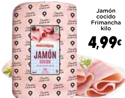
Jamón cocido Frimancha kilo