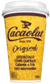
Batido Original Cacaolat vaso 200 ml. 5,75 €/litro