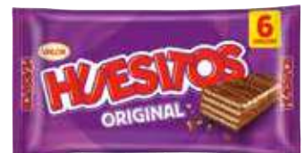
Ambrosias Huesitos Pack 6x20 gr. 12,50 €/kilo