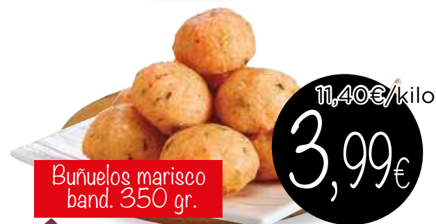
Buñuelos marisco band. 350 gr.