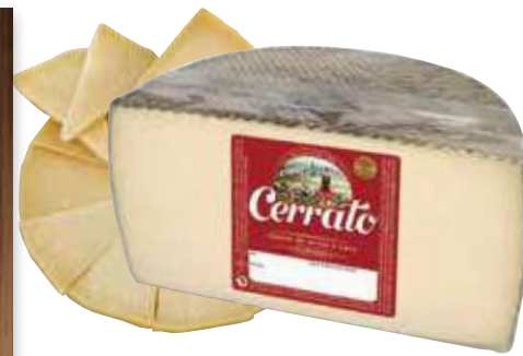
Queso curado Cerrato media pieza