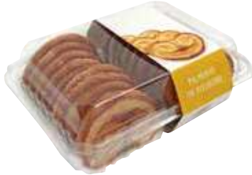
Palmeras Brezo 250 gr. 8,20 €/kilo