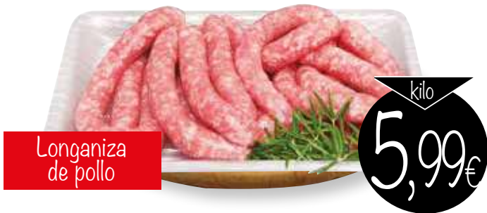
Longaniza de pollo