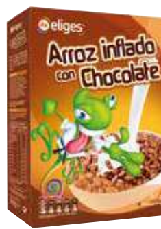
Cereales arroz inflado chocolate lfa 500 gr. 4,10 €/kilo