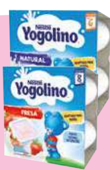
Yogolino de fresa o natural Nestlé 4x100 ml. 5,63 €/kilo