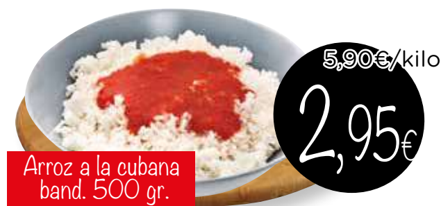
Arroz a la cubana band. 500 gr.