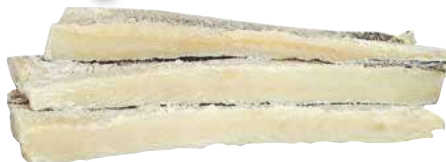
Lomo maruca kilo sugerencia de presentación