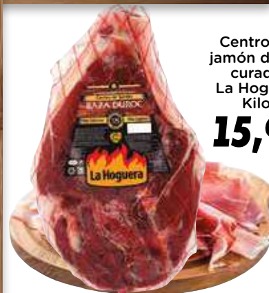
Centro de jamón duroc curado La Hoguera Kilo