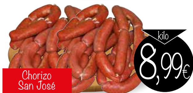
Chorizo San José