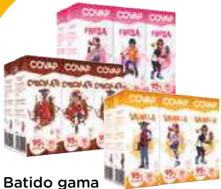
Batido gama Covap pack 6x200 ml. 1,74 €/litro