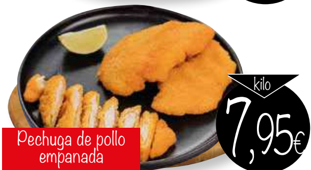
Pechuga de pollo empanada