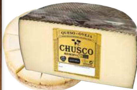
Queso oveja reserva Chusco kilo