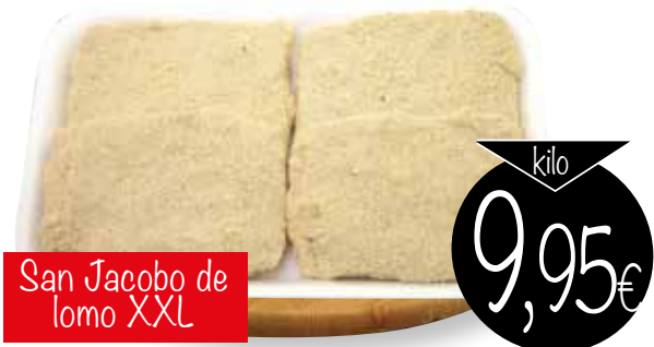
San Jacobo de lomo XXL