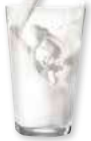
Leche clásica gama o sin lactosa gama Covap Brik 1 litro