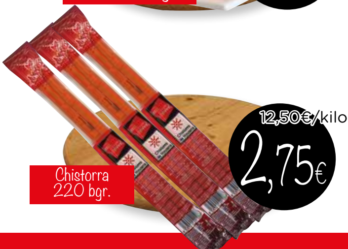
Chistorra 220 bgr.