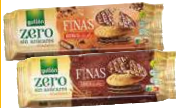
Galleta fina zero avena o chocolate Gullón 150 gr. 13,27 €/kilo