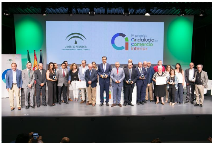
Acto de entrega de los Premios Andalucía Comercio Interior

los Premios Andalucía Comercio Interior, en el CaixaForum de Sevilla.