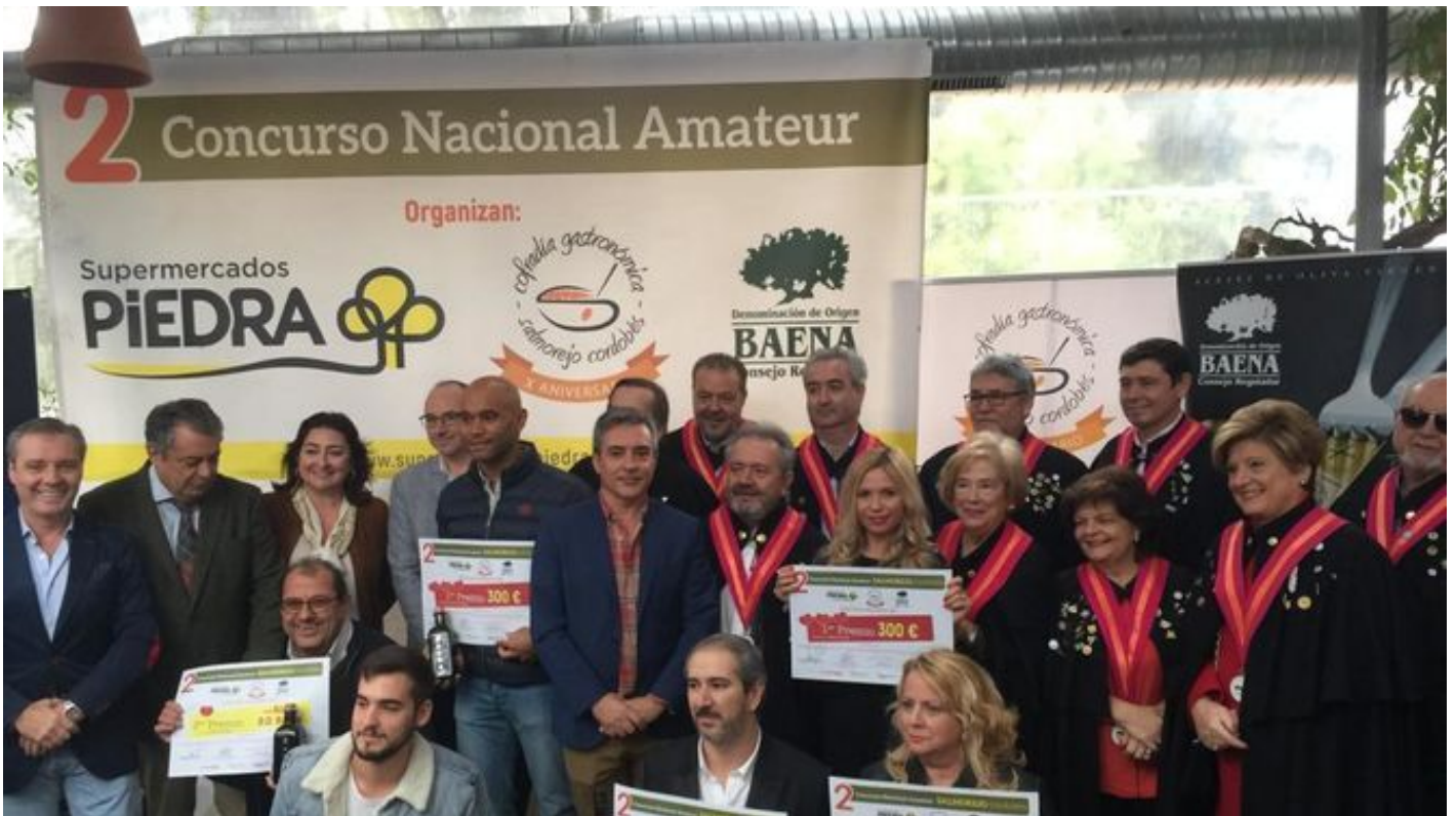
Los ganadores del certamen en el Mercado Victoria.